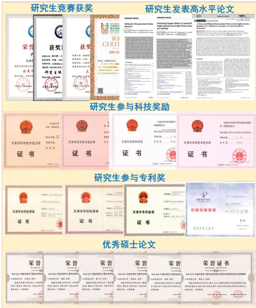
图 4 研究生培养和育人成效

就业质量和育人质量明显提升：高质量就业率多年来保持 96%以上，15 名硕士生赴美国威斯康星大学、加拿大英属哥伦比亚大学、日本东京大学、德国哥廷根大学等国际排名前 100 的著名高校攻读博士学位或联合培养，涌现出天津渤化集团科技创新部殷伊琳部长、美国密歇根州立大学助理教授杜海顺等优秀毕业生，以及姜贞贞为代表的 50 余名研究生，毕业后主动扎根青海、西藏等西部地区，成为我国盐湖资源开发利用和西部建设的中坚力量。