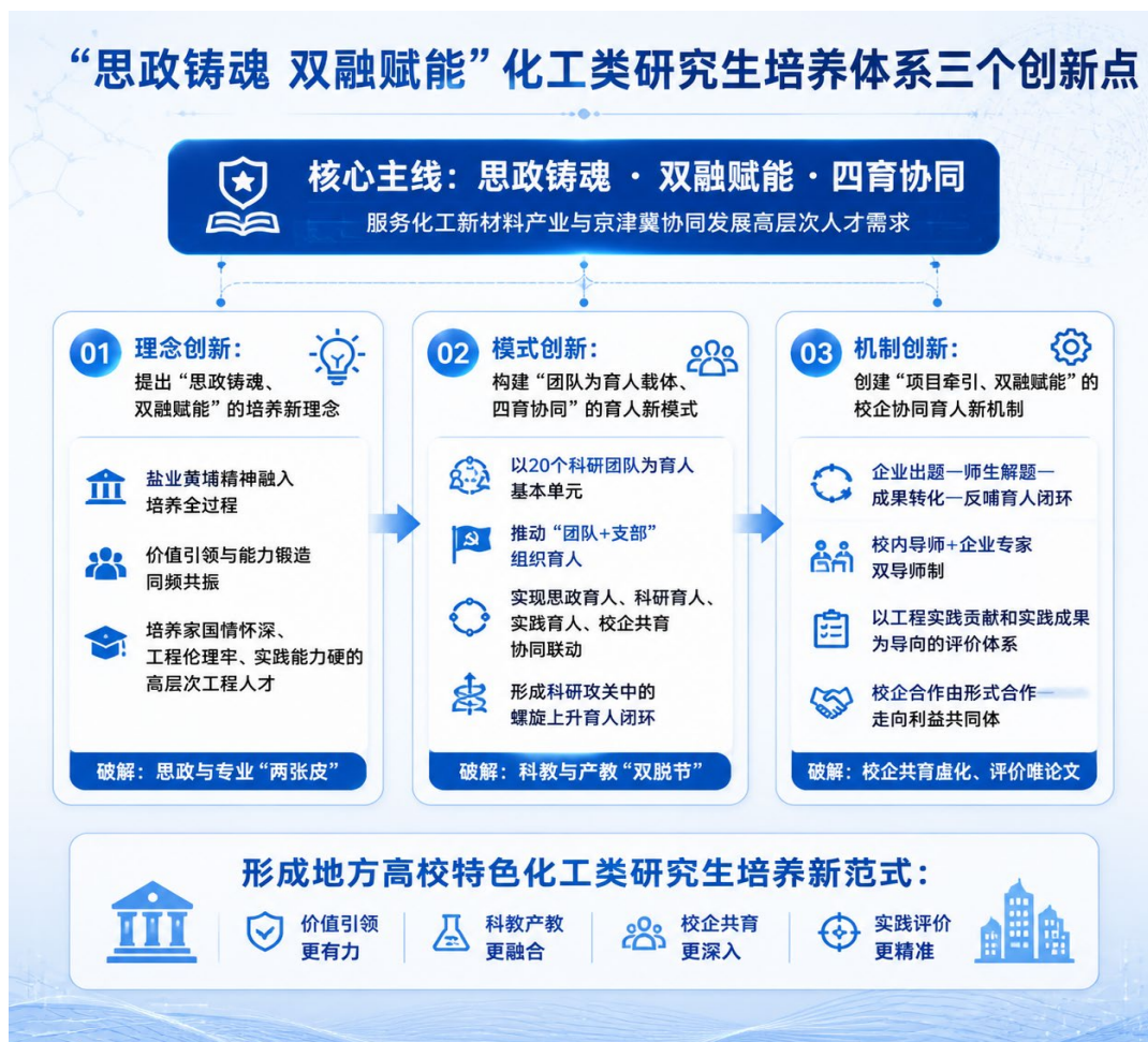
图 4 成果的创新点

教融汇、产教融合为驱动双翼，锚定“家国情怀深、工程伦理牢、实践能力硬”的高层次工程人才培养目标，将价值引领与能力锻造贯穿培养全链条，为地方高校研究生教育“价值引领空洞化、培养理念同质化”的问题提供新的思路。