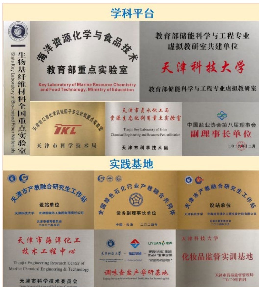
图 5 学科平台和实践基地建设

学科建设迈上新台阶：先后成功获批“化学工程与技术”一级博士点及博士后流动站，“化工新材料”等入选天津市服务产业特色学科群；化学工程进入中国高水平学科。