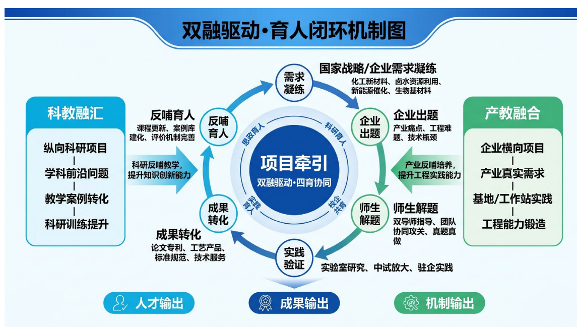
图 3 双融赋能全链式育人机制和路径

以 20 个聚焦盐科学、工业结晶、卤水资源利用、新能源催化、生物基高分子材料等领域的科研团队为基本组织单元，以科研项目为牵引，科教融汇、产教融合为双引擎，有机结合有组织科研与分类培养，打通从基础研究到工程应用的完整育人链路。