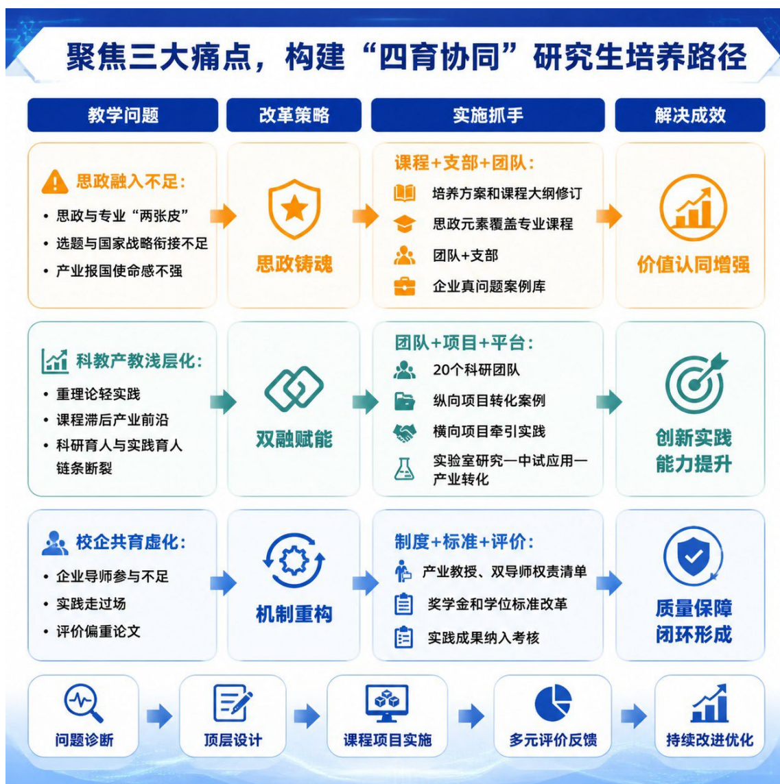
图 2 成果解决教学问题的方法和路径